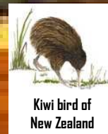
Kiwi bird of New Zealand

Come and join us at AHEPA... YOU CAN MAKE A DIFFERENCE